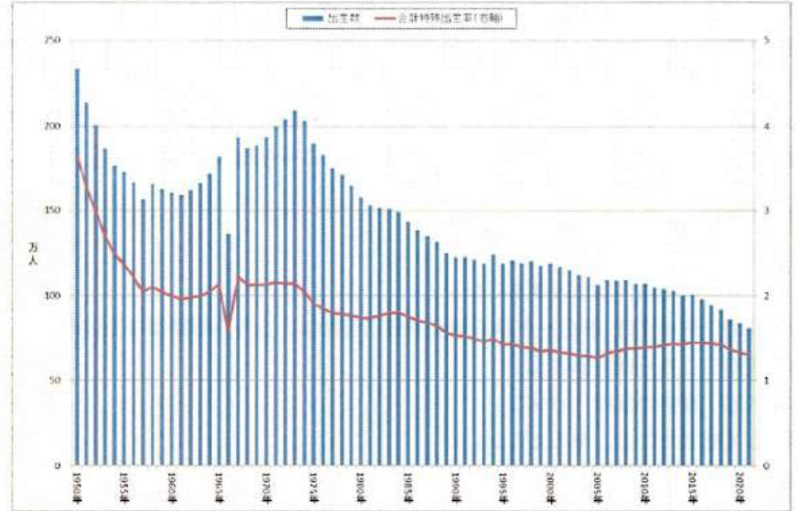
～厚生労働省「人口動態統計」より（2021年まで）～